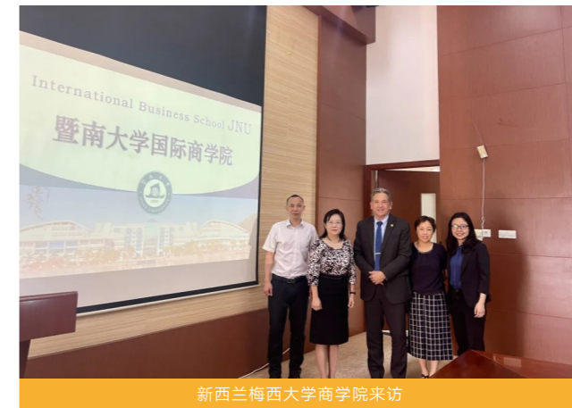
新西兰梅西大学商学院来访

为提高学术研究水平和人才培养质量，院校每年定期开展多批短期出国（境）研究项目，并组织多期研究生参加国际学术会议项目的遴选，资助一批优秀研究生到国（境）外本学科领域一流大学或研究机构进行短期研究和访问。