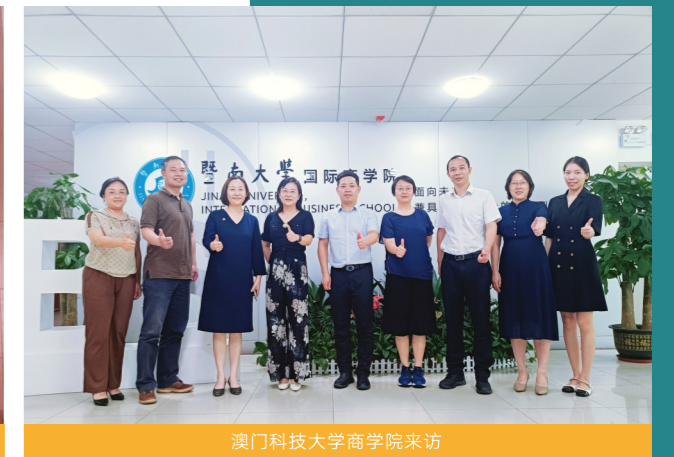
澳门科技大学商学院来访